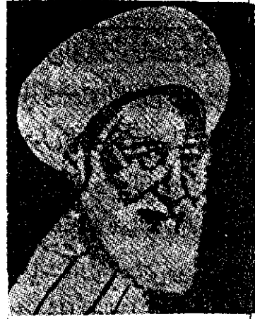
عالم اہل سنت کے مختصر حالات زندگی ناہجنا ب شیخ سلیم البشری

جناب شیخ سلیم البشری جو الکی مسلک رکھتے تھے ۱۲۴۹ھ مطابق ۱۸۳۲ء میں ضلع بیزہ کے محلہ بشر میں پیدا ہوئے اور جامعۃ الازہر (قاہرہ - مصر) میں تسلیم حاصل کی۔